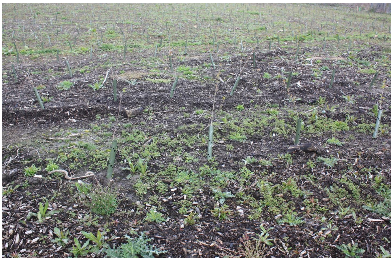
Figure 6 : Les distances de plantation sont comprises entre 50 cm et 70 cm. Dans cet exemple, la zone renaturalisée couvre environ 3 hectares.

Au total, 18 espèces différentes ont été plantées, mélangées en fonction de la position et de l'emplacement des plantes et de la plantation précédente. Le calcul de la plantation a été basé sur un taux d'échec de 12 %.