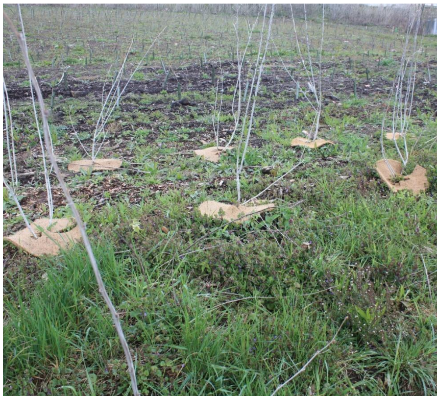
Figure 4 : Vue 1 d'un habitat reconstitué

Pour illustrer comment la réalisation d'une reconstruction d'habitat peut avoir lieu, nous avons joint quelques photos résultant de la reconstruction d'un habitat qui a été affecté par la pose d'un gazoduc européen et qui a pu être reconstruit par la suite.