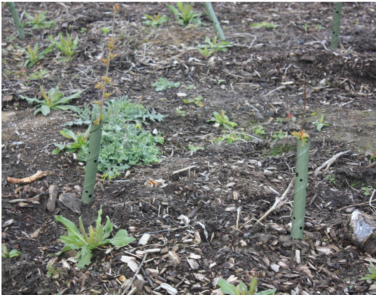
Figure 5 : Jeunes plantes avec revêtement antifeedant

Pour contrer la prolifération des herbes, des disques de fibres de noix de coco sont placés autour des buissons. Ceux-ci réduisent la perte d'humidité du sol et le risque de prolifération. Après environ 2 ans, les anneaux de protection se décomposent et sont complètement dégradés écologiquement.